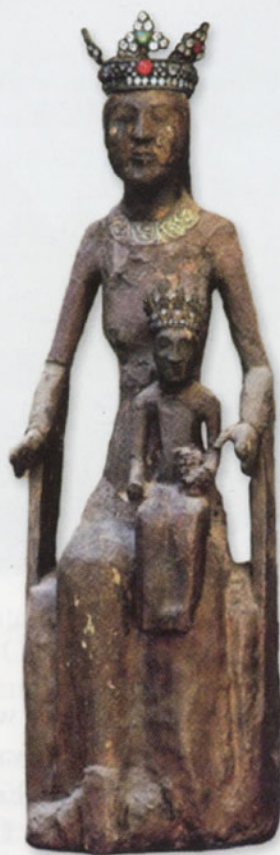
Sculpture de la Vierge Noire

Il serait impossible d'énumérer ici tous les bienfaits et miracles survenus dans ce lieu grâce à Saint Amadour et à la Vierge Noire. Ce